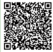
金管局跨境保險專頁