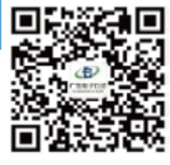
線上諮詢： 廣東電子口岸