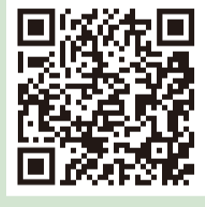
澳門海關澳車北上專頁